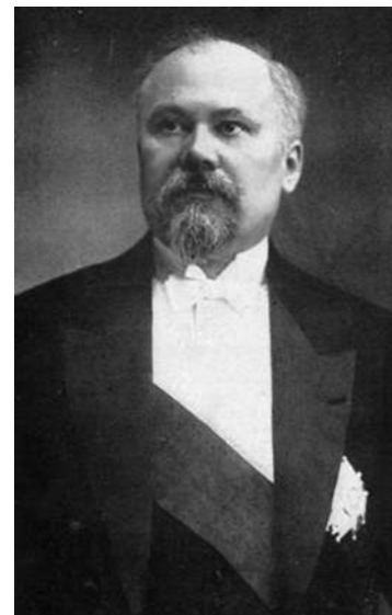
Раймонд Пуанкаре http://wwi.sbn.bz/king/24.jpg

В июле 1914 года в Россию прибыл с визитом и для укрепления франко-русской дружбы президент Франции Раймонд Пуанкаре .