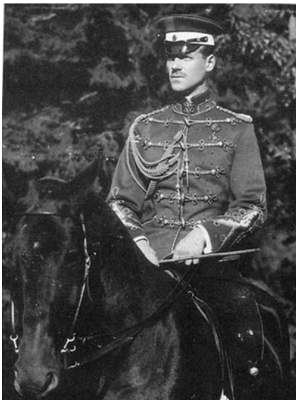
Полковник Михаил Романов в Орле. 1909 г. http://www.permonline.ru/~museum/romanov/rus/excurs/ex14/

Там с красоткой в штатском платье Отправляюсь в Метрополь И, беря её в объятия, Пью искристый «Монополь».