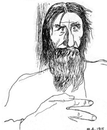
Ю. Анненков. Григорий Распутин. 1915*

судом над самой императорской четой и мог повлечь за собой серьёзные последствия для монархии и монарха. Поэтому участники были подвергнуты лишь такому преследованию: князь Ф. Ф. Юсупов (он не служил в то время на военной службе) был выслан в Курскую губернию на жительство в собственное имение, великий князь Дмитрий